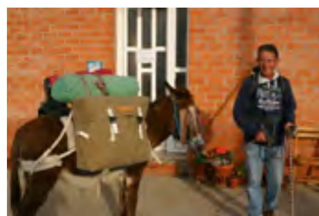
llegado hasta nuestro albergue.

• En el anterior número, comentábamos que una joven peregrina había establecido un record en el albergue comiendo cuatro platos de lentejas. Como no podía ser de otra forma, los records, están para superarlos y ha sido un peregrino italiano el que llegó a cinco platos. Un compatriota suyo quiso emularle, pero se quedó en cuatro, que tampoco está mal.